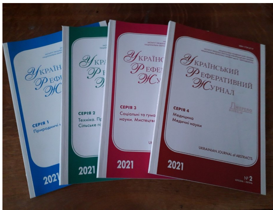
Рис. 2. Чотири серії УРЖ «Джерело»

З 2004 року видаються чотири серії УРЖ (рис. 2) за тематичними розділами наукових знань (з першої серії виділили медицину та зробили окрему серію).