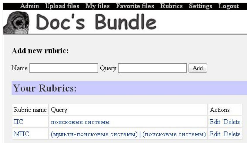
Рис. 3. Сторінка додавання користувацьких рубрик

Розглянута модель уже нині знайшла своїх користувачів і дозволила сформулювати складніші завдання, які мають бути вирішені при побудові корпоративних інформаційно-аналітичних систем [9, 10]. Передбачається, що результати проведених досліджень складуть теоретичну базу для розробки автоматизованих систем моніторингу, адаптивної агрегації і узагальнення інформаційних документальних потоків, побудови і ведення політематичних інформаційних ресурсів надвеликих обсягів (Big Data), дозволять поєднати в єдиному технологічному ланцюжку моніторинг, інформаційний пошук, агрегацію інформації зі змістовним аналізом даних, їхнім узагальненням, що підвищить якість обробки інформації з глобальних мереж, і, відповідно, ефективність інформаційно-аналітичної підтримки науково-аналітичної діяльності вітчизняних учених і фахівців.