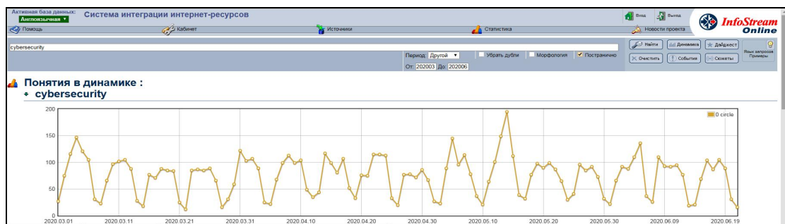
Рис. 1. Фрагмент інтерфейсу системи контент-моніторингу, на якому у вигляді графіка представлений вектор динаміки публікацій за тематикою «кібербезпека»

На рис. 1 наведено фрагмент інтерфейсу користувача отримання динаміки, що відповідає тематичці «кібербезпека». Запит до системи англійською мовою: Cybersecurity .