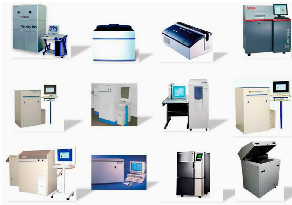
Рис. 1. Приклади СОМ-систем

На рис. 1 наведено декілька прикладів СОМ-систем, які використовують для виготовлення мікрофільмів.